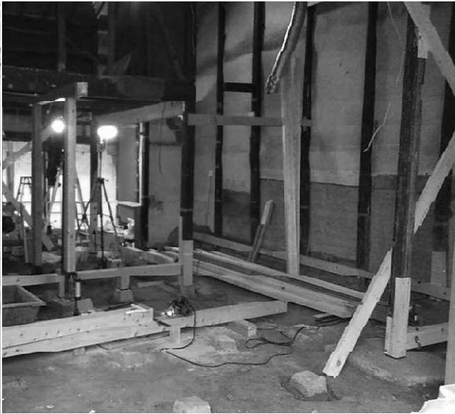
構造改修 施工風景